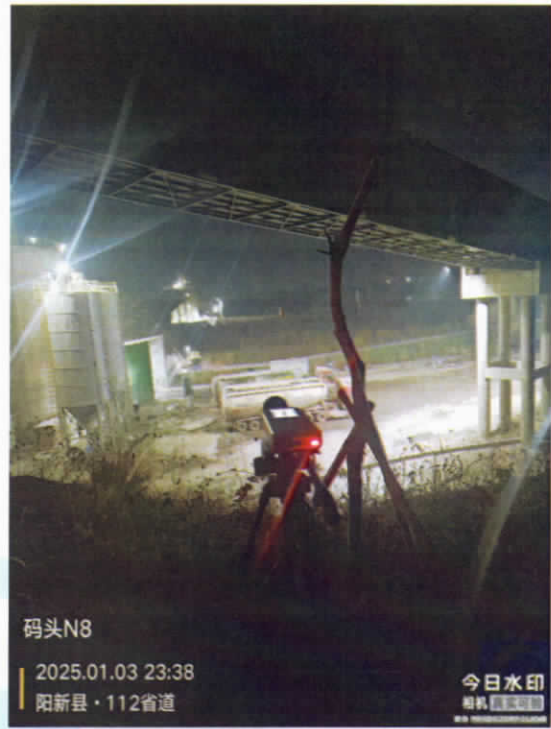
码头厂界东南 2 侧外▲8 (夜)