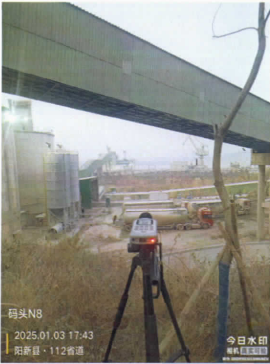
码头厂界东南 2 侧外▲8 (昼)